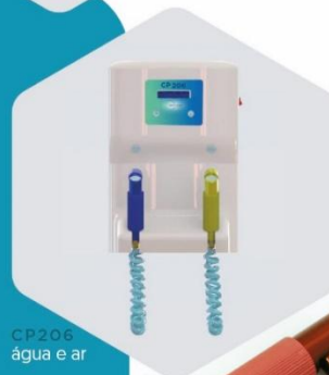
CP206 água e ar